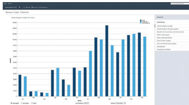
Aktuelle Kennzahlen präsentiert Lexware buchhaltung auf klaren Dashboards.

Viele Schnittstellen: Die Buchhaltung ist keine Insel, sondern Teil eines Gesamtprozesses, weshalb Schnittstellen eine hohe Bedeutung haben: Lexware buchhaltung verarbeitet Daten aus Schwesterprogrammen wie auftrag+faktura , lohn+gehalt oder reisekosten . Hinzu kommen relevante E-Rechnungsformate für Eingangsrechnungen. Auf der anderen Seite gibt es Anbindungen zu den Finanzbehörden und dem Steuerberater. Wer mehr Funktionen benötigt, kann auf größere Programmversionen wechseln und zusätzliche Arbeitsplätze und Funktionen wie das Kassenbuch ergänzen. Bestehende Daten kann man dabei einfach übernehmen.