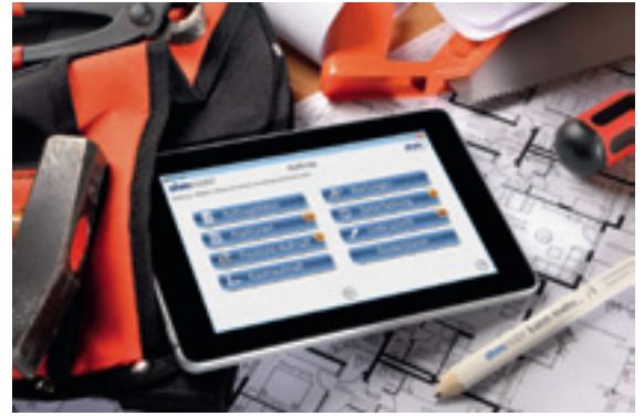
Die Palette der mobilen Lösungen reicht vom „mobilen Auftrag“ bis zum „mobilen Büro“ (shn Software)

an die Bürozentrale versenden. So kann sofort die Rechnung gestellt werden, was die Rechnungsstellung beschleunigt und die Unternehmensliquidität verbessert. Einen Schritt weiter in Richtung Mobilität geht das „mobile Büro“. Dabei werden alle im Büro verfügbaren Unternehmens- und Projektdaten sowie wichtige oder sämtliche Programmfunktionen der Branchensoftware auch mobil zur Verfügung gestellt. Dadurch lassen sich Aufträge, Angebote und Auftragsbestätigungen, Materialbestellungen, Termine und Ressourcen etc. praktisch genauso mobil managen, wie vom Büro-PC aus. So können schon vor Ort Entscheidungen getroffen, Maßnahmen eingeleitet und Aktivitäten koordiniert werden, was den Unternehmens-Workflow erheblich beschleunigt. Wichtig ist, daß sich die Menüoberfläche