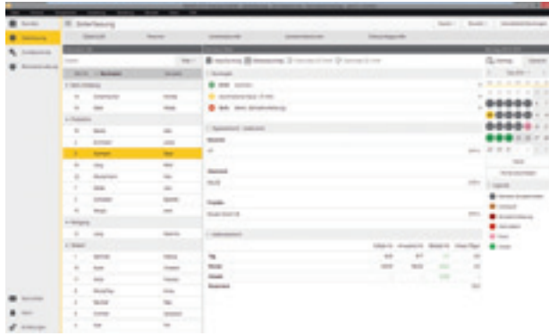
timeCard Zeiterfassung (Reiner SCT) – siehe auch Artikel auf Seite 28