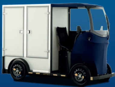
Abb. zeigen Sonderausstattung.

Elektrotransporter und Cargobikes. Nachhaltig für's Handwerk.