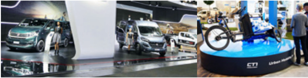
In Hannover stellte Fiat seinen Talento (links, grün) neu vor.