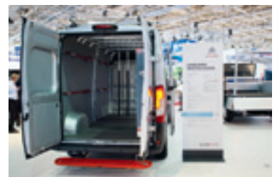
Der Citroën Jumper Service Plus Solution mit Würth-Einbauten und Ladungssicherungen.