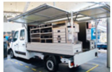
Gedacht für die Wald- und Forstwirtschaft ist dieser Alucaaufbau auf einem Opel Movano.