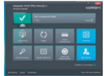
Hauptansicht der auf einem PC installierten Kaspersky Small Office Security-Suite.

Die Kaspersky Small Office Security 4 bietet umfassende Schutzmechanismen zur Sicherung der Computer und mobilen Geräte von kleinen und mittelgroßen Betrieben bis 25 Arbeitsplätzen. Die Handhabung und Bedienung ist sehr anschaulich und einfach. Darüber hinaus unterstützt sie auch die schnelle und bequeme Fernwartung der Security-Suite-Funktionen aller Computer im Unternehmen. <<