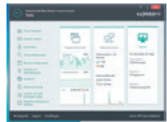
Beim Aufruf des Hauptansicht-Feldes „Zusätzliche Tools anzeigen“ erscheinen auf dem PC diverse nützliche zusätzliche Informationen.